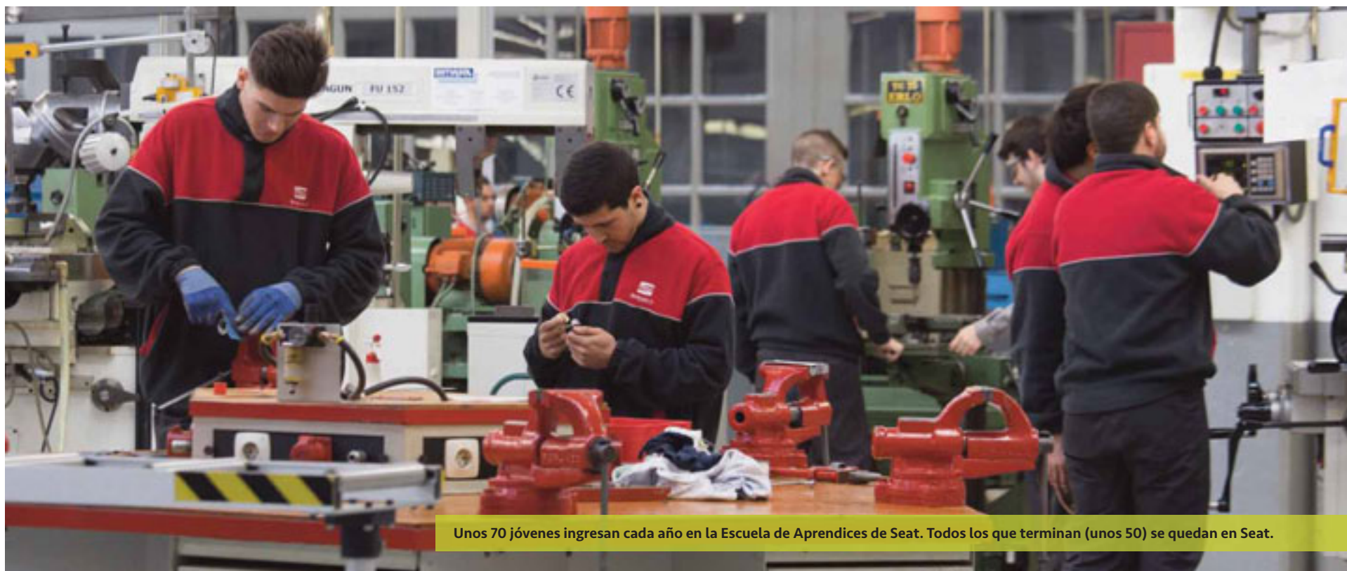
Unos 70 jóvenes ingresan cada año en la Escuela de Aprendices de Seat. Todos los que terminan (unos 50) se quedan en Seat.